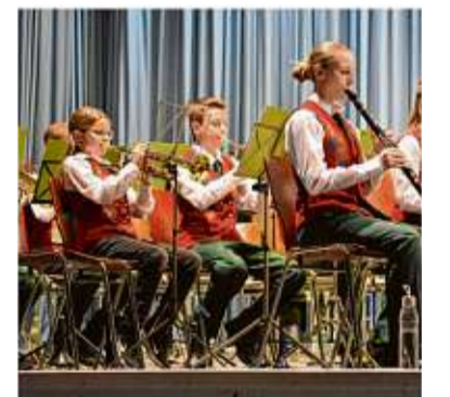
Zum Auftakt spielte am Samstag die Jugendkapelle in der Tübinger Waldorfschule.